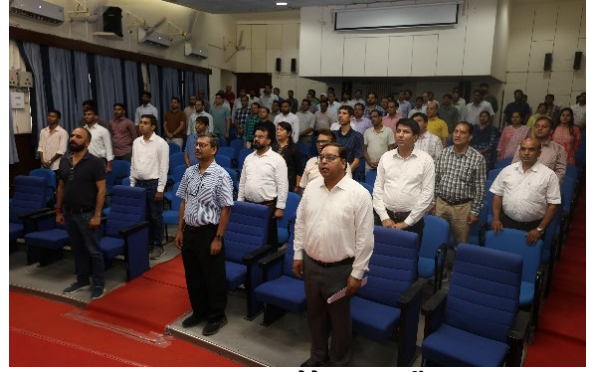
स्वच्छता शपथ लेते हुए सहकर्मी

स्वच्छता केवल एक अभियान नहीं, बल्कि जीवनशैली का महत्वपूर्ण हिस्सा है, जिसे हम सभी को अपने दैनिक जीवन में अपनाना चाहिए।