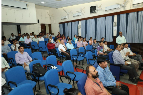
व्याख्यान के दौरान अतिथि से चर्चा करते हुए सहकर्मी

इस अवसर पर आमंत्रित अतिथि एवं निदेशक, सीएसआईआर-सीरी ने भाषण प्रतियोगिता के विजेताओं को पुरस्कार भेंट कर सम्मानित किया। विजेताओं का विवरण इस प्रकार है :