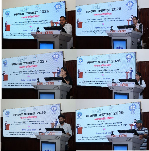
भाषण प्रतियोगिता में भाग लेते हुए प्रतिभागी