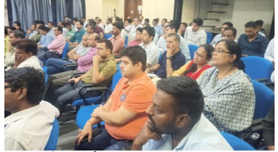
कार्यशाला के दौरान सभागार में उपस्थित सहकर्मीवृंद

बताया कि केंद्रीय कर्मचारियों के रूप में न केवल कार्यालय अपितु कार्यालय से बाहर भी हमारा लगभग प्रत्येक आचरण/व्यवहार 'आचरण नियमावली' के दायरे में आता है। उन्होंने नियमावली के महत्वपूर्ण बिंदुओं को रेखांकित करते हुए उच्चतम न्यायालय के तत्संबंधी निणयों की भी चर्चा की। कार्यशाला में उपस्थित सहकर्मियों से परस्पर संवाद के दौरान उन्होंने सहकर्मियों के प्रश्नों का उत्तर देकर उनकी जिज्ञासा को शांत किया। अंत में उन्होंने यह अवसर उपलब्ध कराने के लिए निदेशक, सीएसआईआर-सीरी के प्रति आभार व्यक्त किया।