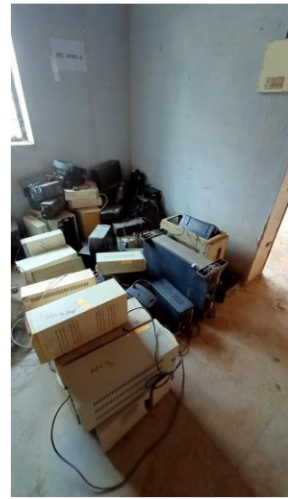
Near Receipt Section

08 Scrap UPS & Batteries (E-waste) UPS & Batteries Total: 1 Lot