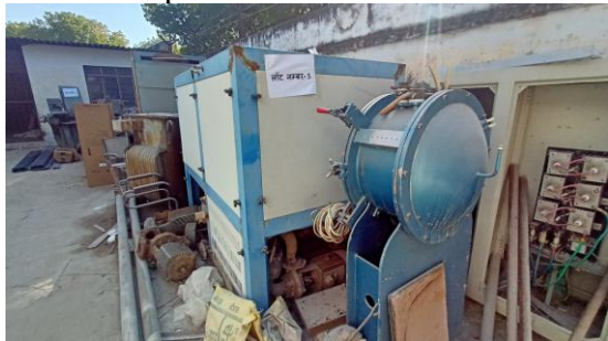
Near Receipt Section

05 Scrap Scientific Equipment and Workshop Machine ZEISS Measuring Projector, Illumination Device, ZEISS Projection Dividing Head, Mask Maker, Anelva Reactive Etching System, Vacuum Pump, Silox System, RF Sputter, Electro heat High Temp. Furnace, Thermostat, Photography Analyser, Engraving & Milling Machine, Hardness Tester "Rock Well", Automatic Saw. Sharpener, Tool maker Monarch, B&S Surface Grinding Machine etc. Total: 1 Lot