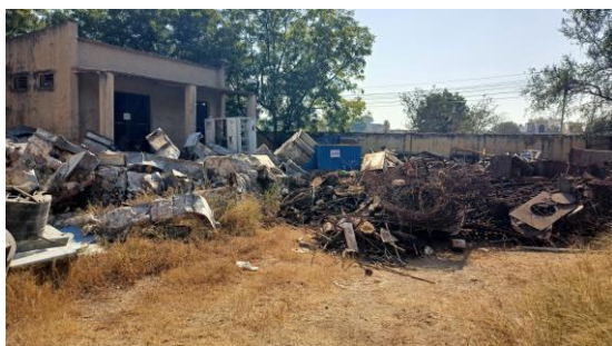
Disposal Yard & Near Receipt Section

06 Scrap Miscellaneous items Iron Scrap like GI pipes, MS Window, Rolling MS Shutter, GI Ducting and Scrap Reinforcement steel bar. Plastic scrap like PVC water tank, Sintex Rectangular tank and flush tank. Wooden Scrap like wooden door and wooden window. Scrap of AC plant, electric panel and valve etc. Total: 1 Lot