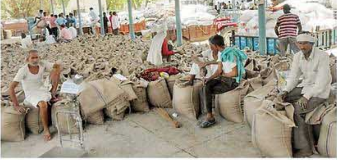
सूराजगढ़, खरीद केंद्र पर किसानों की लंबी लाइन में टोकन जारी कार्य, किसानों के डरकार में फरफेरा।

ऑनलाइन रजिस्ट्रेशन करवा कर टोकन लेकर समर्थन मूल्य पर अनाज बेचना किसानों के लिए मुश्किल पैदा कर रहा है। ऑनलाइन रजिस्ट्रेशन में किसानों को जो शिथिल अनाज बेचने की मिल रही है, वह खरीद केंद्र पर लागू नहीं हो रही। सोमवार को डाबड़ी बत्तीदा के किसान समर्थन मूल्य पर चना लेकर बेचने आए, लेकिन उनकी उपज नहीं खरीदी गई क्योंकि ऑनलाइन रजिस्ट्रेशन से तो उनको 23 अप्रैल की तारीख दी गई थी, लेकिन खरीद केंद्र पर कहा गया, 'तीन दिन बाद आना।' इससे किसान परेशान हो गए और उन्होंने प्रदर्शन किया। बाघ में अभिचारियों ने यह कह कर उन्हें राहत दिया कि व्यवस्था सुधारी जा रही है।