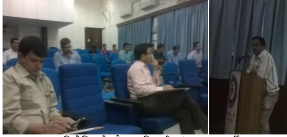
प्रतियोगिता के दौरान प्रतिभागी एवं अन्य सहकर्मी

इस प्रतियोगिता के अंतर्गत प्रतिभागियों द्वारा संस्थान परिसर की स्वच्छता एवं सौन्दर्य से संबंधित विषयों पर खींची गई नवीनतम फोटोग्राफ प्रविष्टि के रूप में जमा कराई गई।