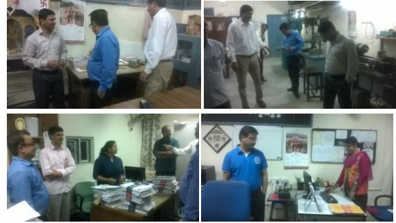
संस्थान के अनुभागों/प्रभागों का निरीक्षण करते हुए अधिकारी

इस दिन संस्थान के सहकर्मियों ने प्रातः 9:00 बजे से सायं 4:00 बजे तक अपने-अपने विभागों/अनुभागों में अपने कार्यस्थल की साफ सफाई की इसके बाद निदेशक महोदय की गठित समिति ने संस्थान के कुछ अनुभागों/प्रभागों में निरीक्षण भी किया।